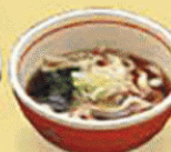
「ミニうどん」(温・冷)