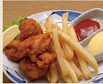
唐揚げポテト ¥550 (税込¥605)