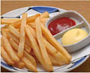
フライドポテト ¥380 (税込¥418)