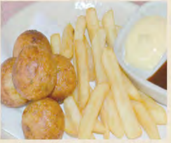
ポテト揚げたこ ¥470 (税込¥517)