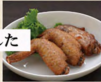
手羽先 ¥560 (税込616円)