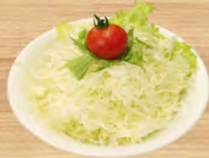
野菜サラダ ¥320 (税込¥352)