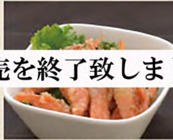
甘海老唐揚げ ¥450 (税込495円)