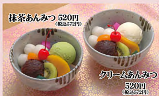
抹茶あんみつ 520円 (税込572円)