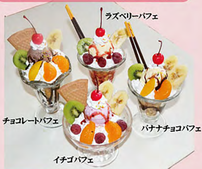
ラズベリーパフェ