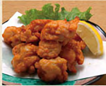
鶏の唐揚げ ¥580 (税込¥638)