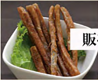
とぼラスティック ¥460 (税込506円)