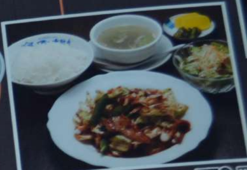
ホイコーロー定食 770円 豚肉とキャベツと野菜の味噌炒め (税込847円)