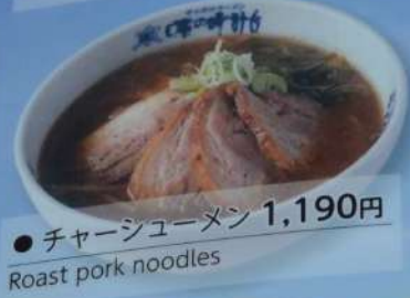
● チャーシューメン 1,190円 Roast pork noodles