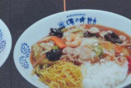
あん中 910円 (税込1001円) あんかけ焼きそばと中華丼のハーフ&ハーフ