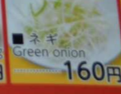
● ネギ Green onion 160円