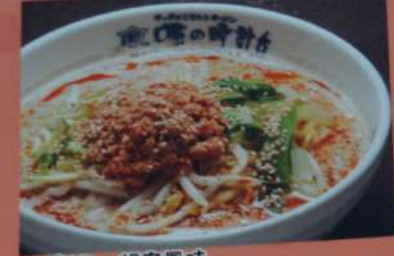
ピリ辛 胡麻風味 坦々麺 830円 (税込913円)