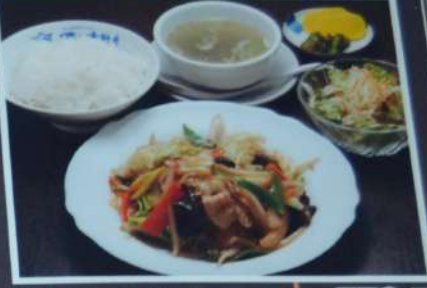
肉野菜炒め定食 770円 (税込847円) 豚肉と野菜の炒め