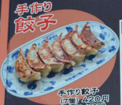
手作り餃子 (7個) 420円 (税込462円)