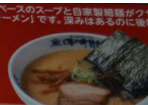
● 塩とんこつラーメン Salt pork bone soup noodles