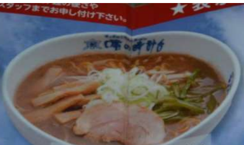
● 正油ラーメン 860円 Syoyu ramen / Soy sauce noodles