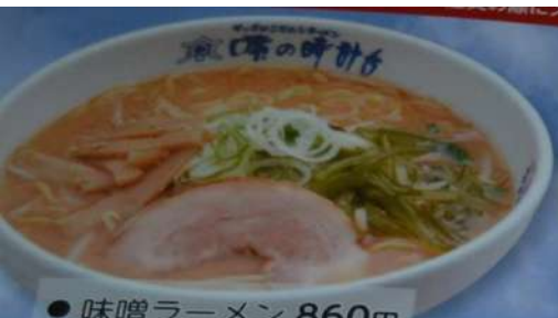
● 味噌ラーメン 860円 Miso ramen / Soy bean noodles