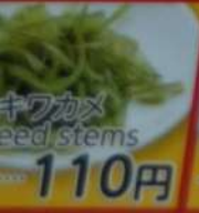
● キワカム Edamame 110円