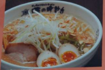
元気モリモリ スタミナラーメン 910円 (味噌・塩・醤油) (税込1001円)