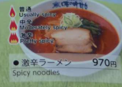
● 激辛ラーメン 970円 Spicy noodles

普通 Usually spicy 中辛 Moderately spicy 激辛 Pretty spicy