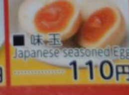
● 味玉 Japanese seasoned Egg 110円