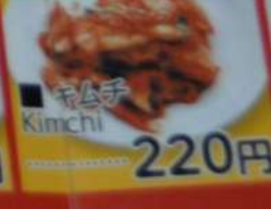
● キムチ Kimchi 220円