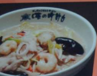
目ラーメン 880円 (税込968円) ・塩・醤油