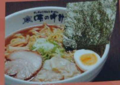
あっさり やさしい あっさりラーメン 680円 (醤油・塩) (税込748円)