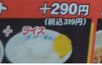
ト + ライス +290円 (税込319円)