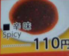
● 辛味 Spicy 110円