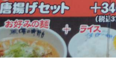
唐揚げセット + ライス +340円 (税込374円) お好みの麺