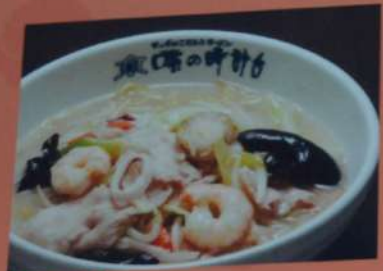
具いろいろ 五目ラーメン 880円 (味噌・塩・醤油) (税込968円)