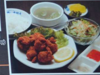
唐揚げ定食 770円 (税込847円) 唐揚げに3種の薬味を添えました (税込847円) (柚子胡椒粉、スイートチリ、マヨネーズ)