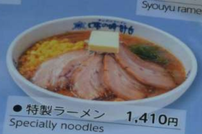
● 特製ラーメン 1,410円 Specially noodles