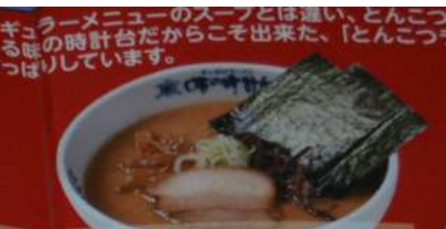
● 正油とんこつラーメン 860円 Soy sauce pork bone soup noodles