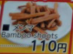
● メンマ Bamboo shoots 110円