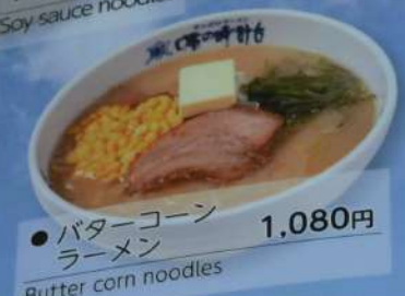
● バターコーン ラーメン 1,080円 Butter corn noodles