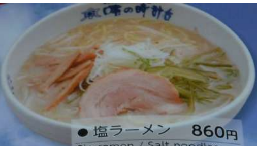
● 塩ラーメン 860円 Sio ramen / Salt noodles