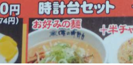
時計台セット + ライス +420円 (税込462円) お好みの麺 + 半チャーハン