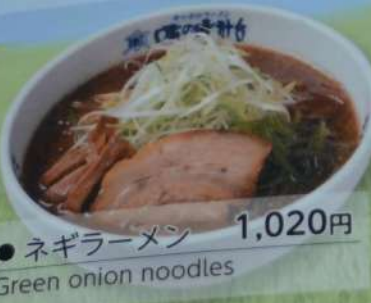
● ネギラーメン 1,020円 Green onion noodles