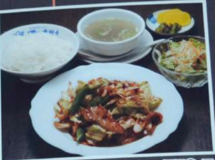
ホイコーロー一定食 770円 豚肉とキャベツと野菜の味噌炒め (税込847円)