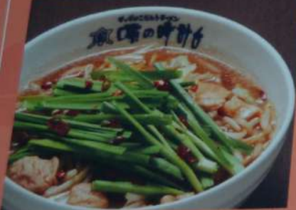
もつにらラーメン 830円 (味噌・塩・醤油) (税込913円)