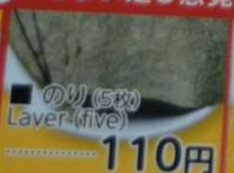
● のり(5枚) Laver (five) 110円