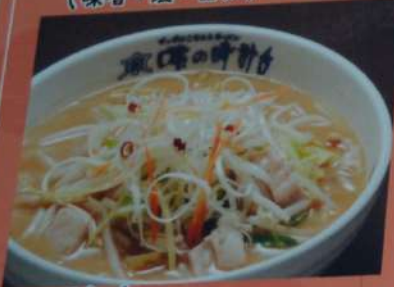
もつがゴロゴロ もつ野菜ラーメン 830円 (味噌・塩・醤油) (税込913円)