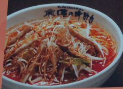
ピリ辛ネギチャーシューメン ピリ辛ネギチャーシューメン 1100円 (味噌・塩・醤油) (税込1210円)