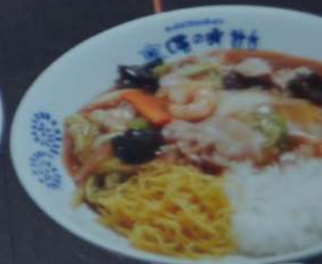
おん中 910円 (税込993円)