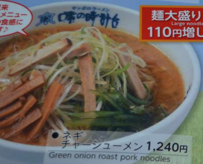
● ネギ チャーシューメン 1,240円 Green onion roast pork noodles