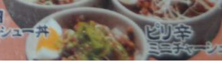
ネギマヨ ミニチャーシュー丼 + ピリ辛 ミニチャーシュー丼