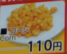
● コーン Corn 110円