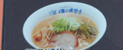
麺の量が半分 ミニラーメン 480円 (税込528円) (味噌・塩・醤油・塩とんこつ・醤油とんこつ)