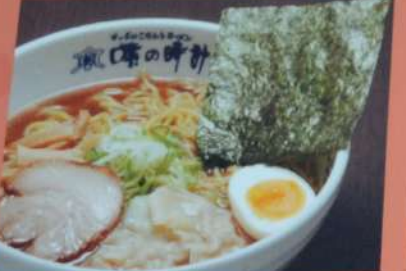
あっさり やさしい あっさりラーメン 680円 (税込748円) (醤油・塩)