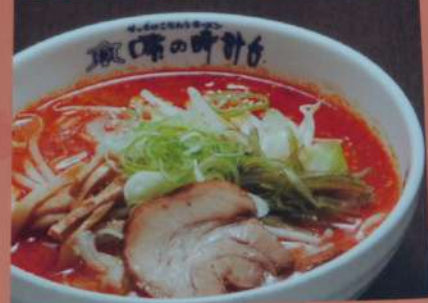
鬼辛ラーメン 882円 (味噌・塩・醤油) (税込970円) ※辛さ1辛～5辛まで選べます (1辛20円増し)