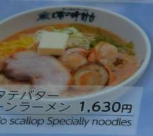
マテバター ンラーメン 1,630円 to scallop Specially noodles