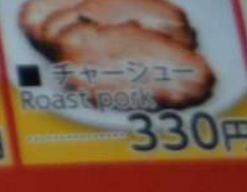
● チャーシュー Roast pork 330円