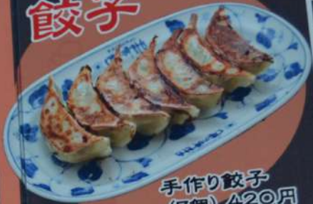
手作り餃子 (7個) 420円 (税込462円)