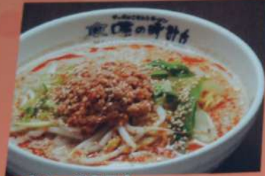
ピリ辛 胡麻風味 坦々麺 830円 (税込913円)