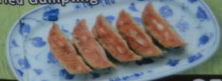
1人前5個 …… 350円