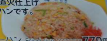
● チャーハン Fried rice …… 770円 ● 半チャーハン Half size …… 380円 ● 大盛りチャーハン Large size …… 880円