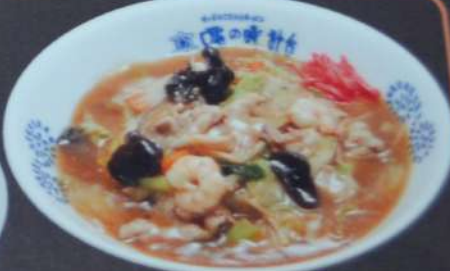
中華丼 830円 (税込913円)