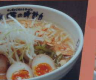
ラーメン 910円 (税込1001円) ・醤油