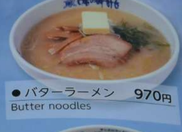
● バターラーメン 970円 Butter noodles