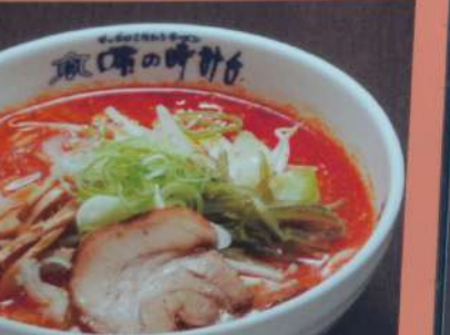
鬼辛ラーメン 882円 (税込970円) (味噌・塩・醤油) ※辛さ1辛～5辛まで選べます (1辛20円増し)