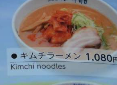
● キムチラーメン 1,080円 Kimchi noodles