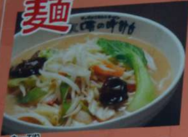
たっぷり 野菜ラーメン 830円 (味噌・塩・醤油) (税込913円)