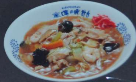
あんかけ焼きそば 830円 (税込913円)