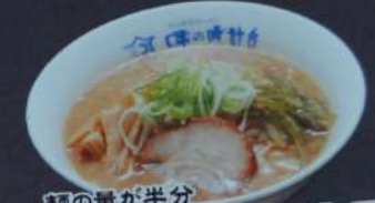
麺の量が半分 ミニラーメン 480円 (味噌・塩・醤油・ 塩とんさつ・醤油とんさつ)