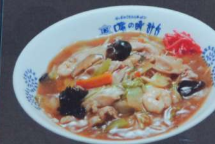
あんかけ焼きそば 830円 (税込913円)