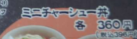
ミニチャーシュー丼 各 360円 (税込396円)